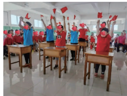
兒童節愛心傳遞活動