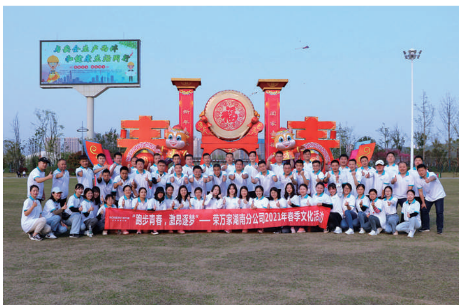
「跑步青春，激昂逐夢」文化活動

本集團積極開展和組織員工活動，舉辦了包括傳統節日慶典、團隊建設、企業文化建設、福利關懷等多方面的員工活動，豐富員工的業餘生活。