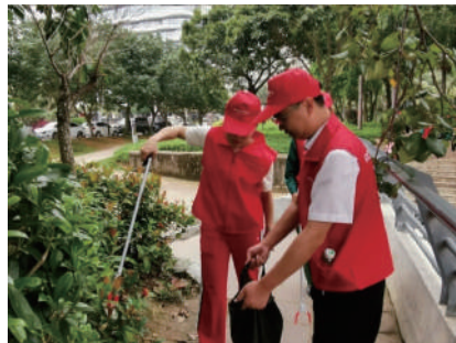
撿拾垃圾公益活動